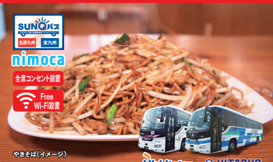
やきそば(イメージ)